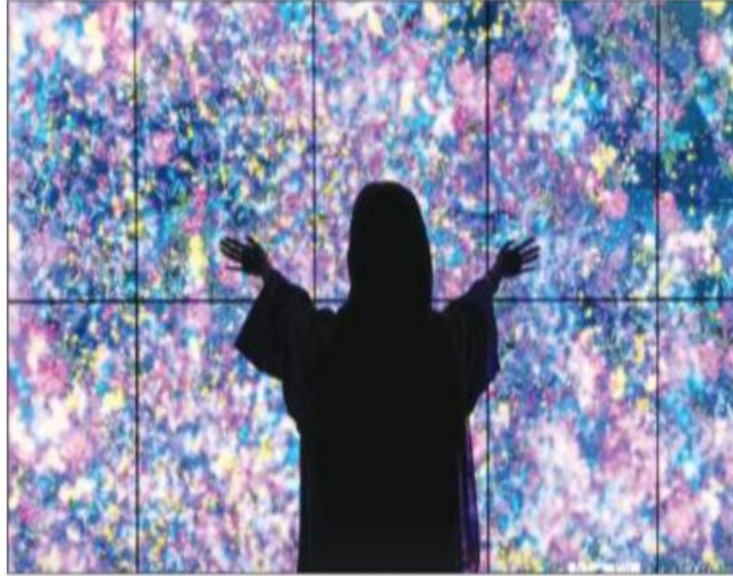
الاحتفالية جاءت لتضفي على الجميع جواً من المتعة عبر الفن والثقافة.

وأوضح أن الانطباع، الذي تركته الاحتفالية على المجتمع «رائع حقاً، حيث جاءت هذه الاحتفالية لتضفي على الجميع جواً من المتعة عبر الفن والثقافة، خاصة مع سلسلة الفعاليات المتنوعة المقامة على هامشها، ونحن سعداء بهذا الإقبال