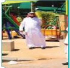
من الجهات الخدمية