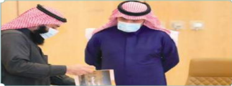
زيارة بلدي الرياض لوزير الشؤون البلدية والقروية والإسكان

تسريع معالجة السفلة بعيداً عن البرامج الدورية إلى إنهاء نقل مكب الحائر ومدفن السلي إلى موقعهما الجديد