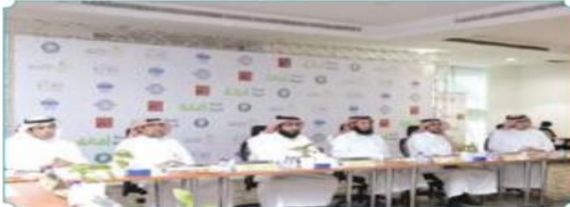
لقاء مع مسؤولي برنامج «إحادة» مناقشة لملاحظات المواطنين والبرامج وأبرز احتياجات المواطنين

مبادرات وطول للمؤبة أشار رئيس بلدي الرياض إلى أن المجلس البلديي قدم خلال الفترة السابقة مجموعة كبيرة من