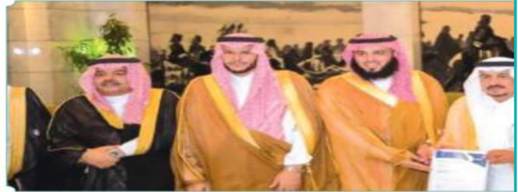
ي. الرياض يتشرف بزيارة أمير منطقة الرياض

وفيما يتخلف بكثرة المصانع ومعامل البلاستيك داخل النطاق العمراني بين رئيس بلدي الرياض أن المجلس قام برفع عدد من التوصيات والملاحظات في هذا الخصوص للأمانة وعدد من الجهات ذات العلاقة لإبعاد المصانع ومعامل البلاستيك عن النطاق العمراني (صناعية الشفا كمنال فيها نحو 300 معمل بلاستيك). وإيقاف الترخيص لمستودعات داخل النطاق العمراني.