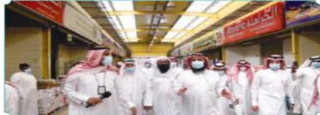
جولة تفقدية لسوق خضار العريدي جنوب الرياض