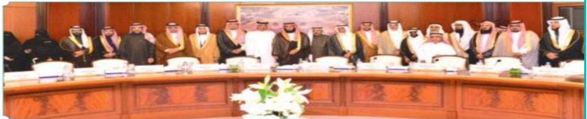
رئيس وأعضاء المجلس البلدي في مجلس الشؤون لرفع الخطط

يستخدمه بسطة مؤقتة مكتفية للتمت. على الرغم من الكثير من المتابعة والمخاطبات.